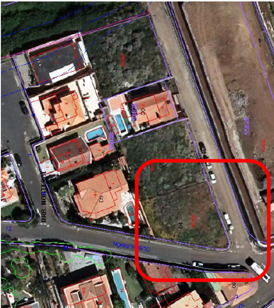
IMAGEN: SUPERPOSICION ALINEACION VIARIA SEGÚN PGO VIGENTE/PARCELA CATASTRAL

1. El objeto del Estudio de Detalle presentado es, según los antecedentes señalados, la modificación de la alineación viaria en el ámbito que afecta al frente de la parcela sita en Calle Mocán cuya titularidad ostenta el promotor de la iniciativa, y que corresponde a parte de la manzana urbanística 9.9 de Area A-9 La Baranda II, según el fichero de ordenación pormenorizada de áreas del vigente PGO.