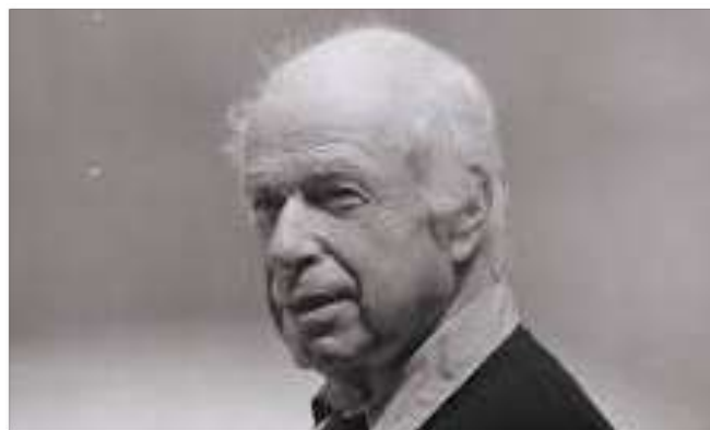
El Teatro Sagrado

A menudo se ignora que algunos "visionarios" de la pedagogía teatral han desarrollado sus teorías de la formación teatral en los límites de lo propiamente teatral, invadiendo las técnicas de desarrollo físico y emocional de matriz oriental y antroposófica. Jacques Copeau, Michail Chéjov, Jerzy Grotowski, Peter Brook, Yoshi Oida son los testigos de esta deriva "sana" de la metodología teatral.